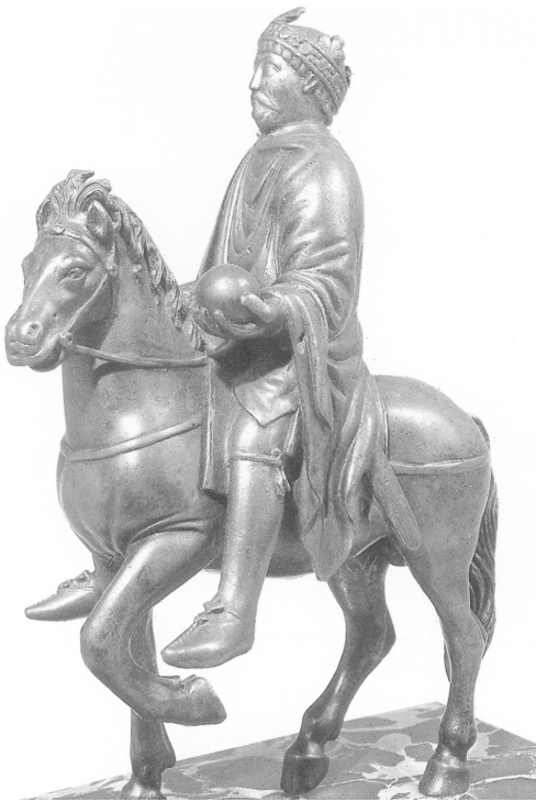
Reiterstatuette, angeblich Karl der Große (Paris, Louvre)