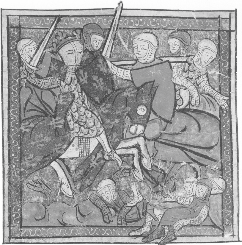
König Philipp II. Augustus in der Schlacht von Bouvines 1214 (Castres, Bibl. mun.)